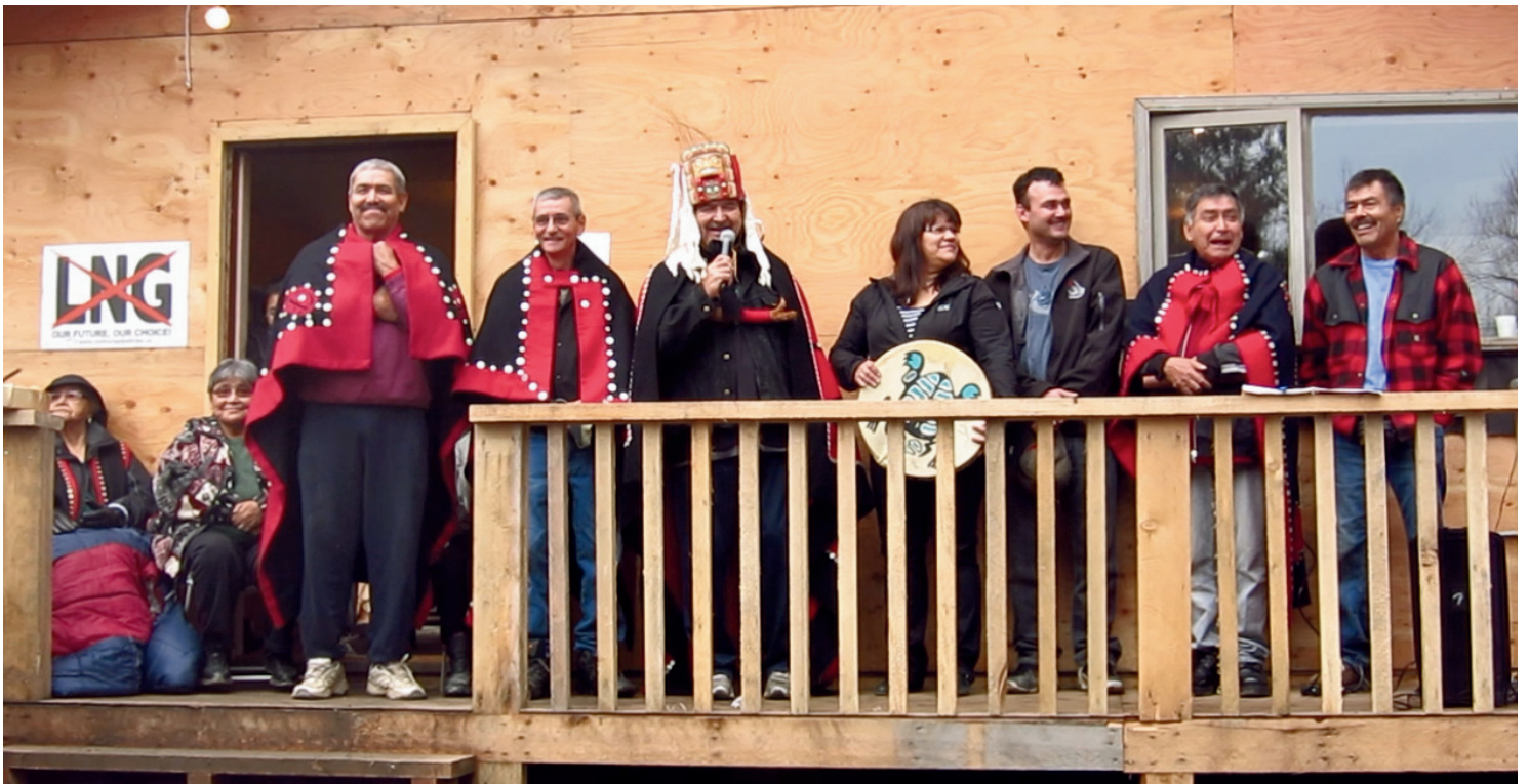
Les chefs et leur famille devant le campement à Madii Lii

L'existence des industries extractives soi-disant canadiennes est fondée sur la violation des droits Autochtones. Par conséquent, se battre pour la souveraineté autochtone est une stratégie climatique puissante.