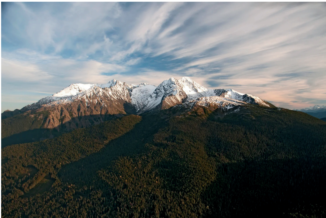
Le Mont Thoen Fronière nord du territoire de Madii Lii

Alors, pour affronter la crise climatique et transformer ce pays, et éventuellement le monde, il sera nécessaire d'avoir de grands et beaux mouvements composés d'alliances fortes entre les nations autochtones, les communautés autochtones de base, les environnementalistes, les syndicats, et plus encore. Cependant, les relations requises pour construire de tels mouvements puissants seront impossibles si les colonisateur·trice·s continuent d'endommager et d'affaiblir les relations en perpétuant le colonialisme et s'approprient le pouvoir, les richesses et les territoires de manière disproportionnée. Plus précisément, les coalitions bâties avec les peuples Autochtones et d'autres communautés touchées risquent moins de reproduire la logique coloniale qui a historiquement mené le mouvement environnementaliste conventionnel.