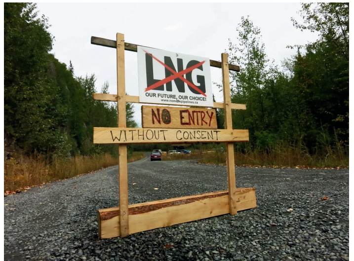
Au kilomètre 15 sur la route forestière de Suskwa (2014)

Plusieurs appels ont aussi été lancés pour des actions de solidarité et de sensibilisation . Déjà, d'un bout à l'autre du soi-disant Canada, différents groupes militants se mobilisent pour soutenir les gardien·nes du territoire de la Colombie-Britannique. Le projet est vulnérable, puisque le chantier a à peine commencé et subit de fortes oppositions. En 2020, le puissant mouvement Shut Down Canada s'est levé partout au pays contre le pipeline Coastal Gas Link en territoire Wet'suwet'en. Cinq ans plus tard, la lutte contre l'extractivisme colonial et écocide continue. Solidarité avec les Gitxsan et les Gitanyow !